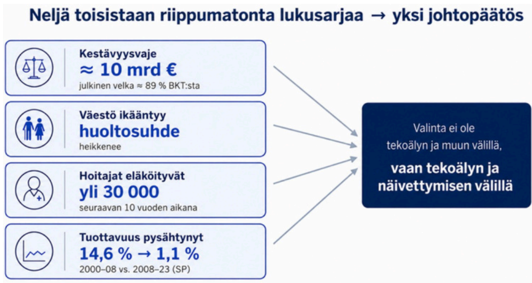
Kuva 2. Neljä toisistaan riippumatonta lukusarjaa, yksi johtopäätös.

Väite siitä, että tekoäly on seuraavan hallituksen tärkein missio , vaatii perustelunsa. Pohjana on teknologiainnostuksen sijaan suomalaisen julkisen talouden yhtälö. Neljä toisistaan riippumatonta lukusarjaa osoittaa samaan suuntaan: